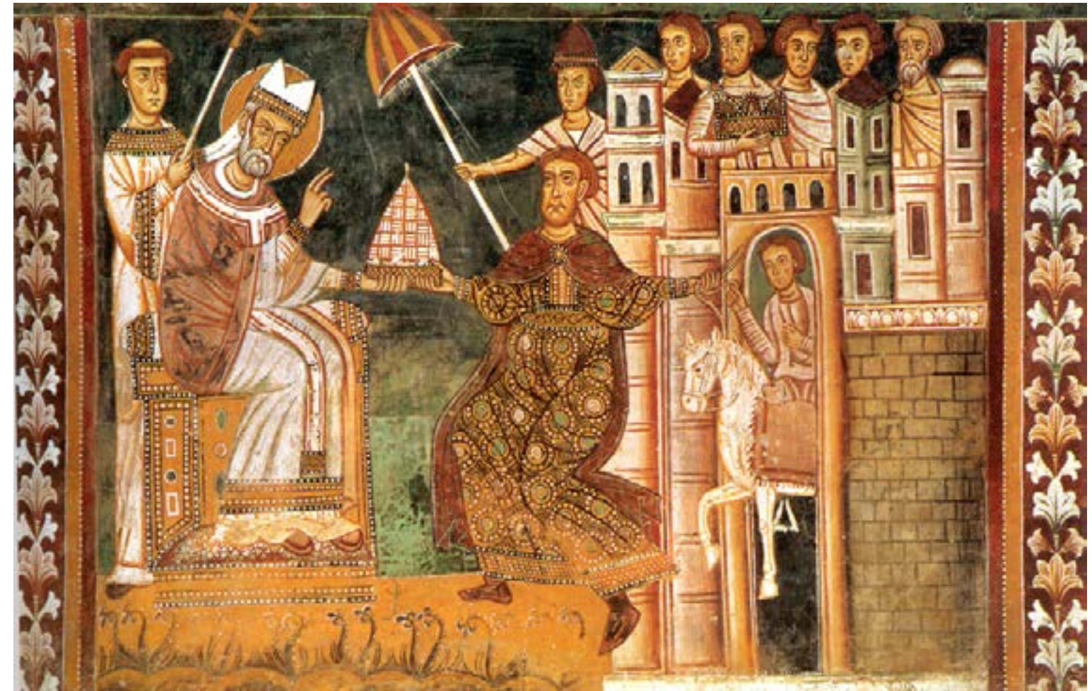
Anónimo. 'La donación de Constantino'. Fresco. S. XIII. Capilla de San Silvestre, Basílica de los Cuatro Santos Coronados. Roma, Italia.

Cuenta con experiencia de más de 21 años como docente ante grupo en diplomados, licenciaturas y posgrados; actualmente se desempeña en la Universidad Virtual Anáhuac, con trayectoria de varios años, donde desarrolla y es docente en diplomados de teoría e historia del arte universal.